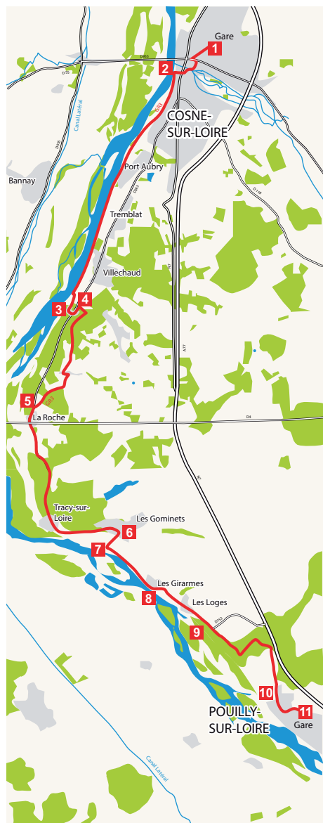
Topo guide : « La Bourgogne à Pied » Carte IGN série bleue : 29210 - 2921E - 2922E

Bienvenue en Bourgogne pour quelques heures de balades. Suivre le balisage indiqué dans le descriptif.